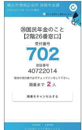
▲「事前WEB発券」画面イメージ

港南区役所へ来庁前に当日の受付番号の事前発券ができるWEB発券をスタートさせ、区役所内での待ち時間を短縮させることが狙いです。自身のスマートフォンで「港南区事前WEB発券サイト」にアクセスし、ウェブ上で番号札を発券します。窓口混雑状況サイトで人数を確認することも可能です。呼出通知サービスもありますので是非ご利用ください。