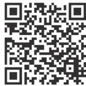
▲窓口混雑状況サイト