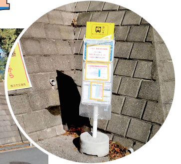
▲188系統停留所『A街区・野庭消防訓練場前』