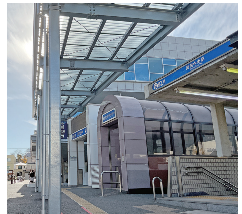
▲カタチになった雨天対策