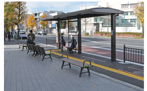
▲新たなバス乗り場(12月18日撮影)