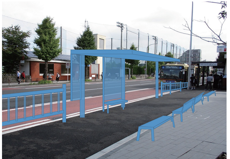
▲バス乗り場完成イメージ