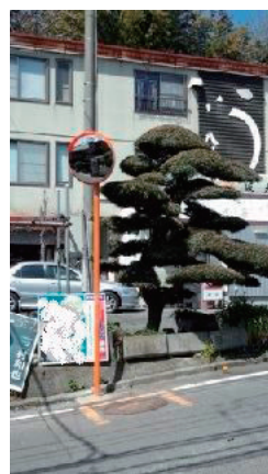
カーブミラー設置